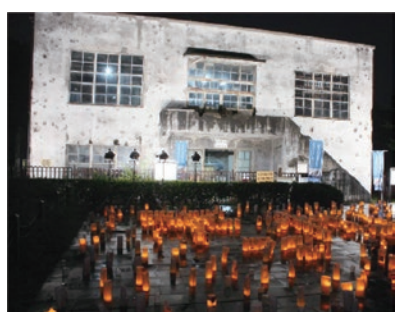
平和の大切さを再認識する機会として、多くの皆さんの参加をお待ちしています。▽問合せ 社会教育課・内線1554まで。

8月は 平和月間です 「恒久平和を願って」 世界の平和と安全を実現することは、人類共通の願いでもあります。市は、恒久平和を願って、平成2年10月1日に「平和都市」であることを宣言しました。平和への願いを込めて、左表のとおり8月の「平和月間」に、平和に関する様々な事業を予定しています。