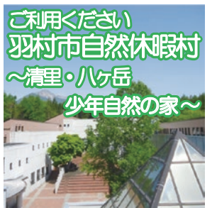
ご利用ください 羽村市自然休暇村 ～清里・ハケ岳 少年自然の家～

1個押します。期間内に2個以上のスタンプを貯めた方には、最終回に景品を差し上げます。なお、景品は1人1個です。申込不要。 ▽問合せ 中央図書館 ☎042-564-2454、桜が丘図書館 ☎042-567-2231、清原図書館 ☎042-564-2944まで。