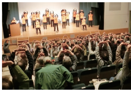
▲昨年の東大和元気ゆうゆう体操フェスタ