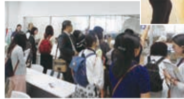
▲台湾からの見学者