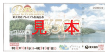
▲プレミアム付商品券見本

(均等割)が非課税の方 ②平成28年4月2日〜令和元年9月30日に生まれたお子さんがいる世帯主の方 ▽購入額 対象者一人につき1冊五、〇〇〇円分のプレミアム付商品券を四、〇〇〇円で5冊まで購入可 ▽購入引換券交付申請手続 ●購入対象者①に該当する方・7月中旬に交付申請書を送付します。手続きの詳細は同封の案内をご確認ください。 ●購入対象者②に該当する方・交付申請は不要です。9月以降、順次購入引換券を送付します。 ▽購入引換券交付申請期間 7月16日(火)〜令和2年2月27日(木)