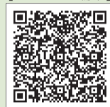
▲ごみ分別アプリはこちらから