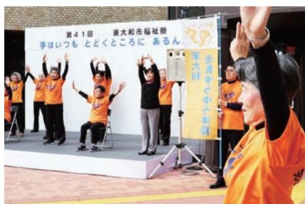
▲東大和元気ゆうゆう体操。昨年11月に開催された福祉祭にて

少子高齢化が急速に進展する中、市民の皆様が健康で生きがいをもって暮らせる社会の実現が必要であると考えております。そこで、高齢者が住み慣れた地域で安心して暮らし続けることができるよう、地域包括ケアシステムの構築を目指してまいります。