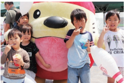
▲5月に開催されたうまかんべえ祭

次に、市内の公共交通を形成するコミュニティバスを将来にわたり持続可能なものとするため、引き続き、利用促進に取り組むとともに、コミュニティ交通につきましても、地域の皆様との協働により、導入に向けて取り組んでまいります。