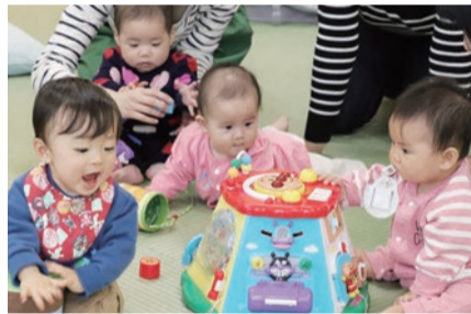
▲子ども家庭支援センター「かるがも」にて

子育て環境の充実につきましては、妊娠、出産、育児などの相談業務の充実、不妊相談の実施、情報提供の充実を図り、家庭のニーズに応じた切れ目のないきめ細かな支援などを行ってまいります。さらに、市の子ども・子育て支援に関する理念やビジョンとなる「(仮称)子ども・子育て憲章」の制定や「東大和市子ども・子育て未来プラン」の策定等により、子どもの最善の利益を守り、子どもの視点に立った環境の整備を図るとともに、子ども・子育て支援施策の充実に取り組んでまいります。