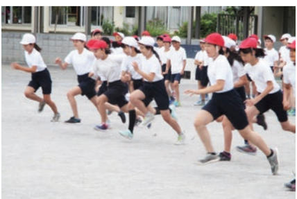
▲市内小学校の授業の様子

小・中学校全校におきまして、児童・生徒の学力向上への取組を推進していくほか、英語教育の更なる充実を図ってまいります。