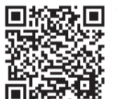
▲幼児教育の無償化についてはこちらから

利用の方は、無償化の認定申請の手続きを開始します。詳細は市のホームページまたは園から配布される案内をご覧ください。