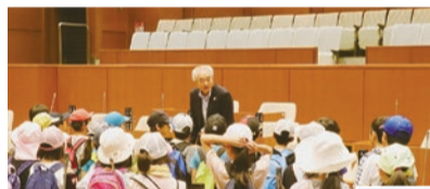
▲議場で説明を受ける子どもたち

5月29日、第十小学校の3年生の児童94人が、社会科の授業の一環として、市役所本庁舎の見学に訪れました。子どもたちは庁舎の1階から順番に各階の執務室や議会の議場などを見学し、最後に庁舎の屋上に上がりました。庁舎内ではおしゃべりもせず、とても静かに職員の説明を聞いていた子どもたちでしたが、開放的な屋上では、大はしゃぎで走り回っていました。最後に職員にたくさんの質問をしていた子どもたち。少しでも市役所の仕事に興味を持ってもらえたら嬉しいです。