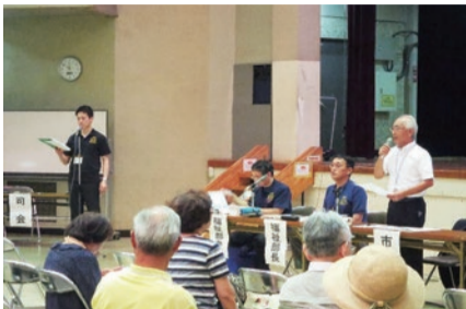
▲昨年8月に開催された「市長と語る会」

市民の皆様と市政情報や地域課題を共有し、信頼関係を深めることが、より効果的な市政運営につながるものと考えております。 開かれた市政の実現に向け、施策の形成や課題の対応に当たっては、市民の皆様の理解と信頼を得られるよう、情報公開の推進と説明責任の徹底を図ってまいります。