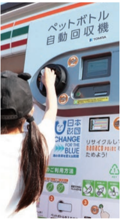
▶市内セブンイレブんに設置されたペットボトル自動回収機

の方々の地域社会への活動を促し、環境に関する地域ボランティア活動を支援してまいります。その他、自転車等の交通ルールやマナー向上の普及啓発を図り、安全通行の確保に努めてまいります。