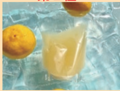
東大和 ソルティーゆず 【ラトリエ・アンソレイエ】