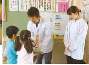
子どもたちからグリーンピースを受け取る調理員▲