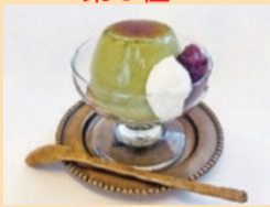
ふわとろ抹茶プリン 【サンサンベーカリー】