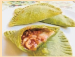
チーズたっぷり！！ 東大和カルツォーネ！！ 【Partire jun】