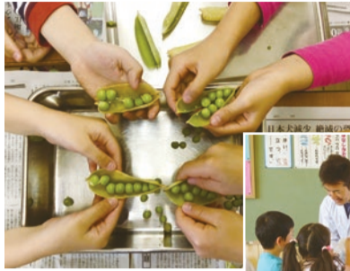
▲グリーンピースのさやむき