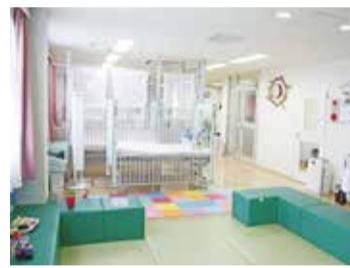
▲病児・病後児保育室

すこやか病児・病後児保育室では、病気で通園・通学できないお子さんをお預かりします。4月1日以降に利用を希望する方は、利用前に登録をお願いします。 ※利用登録済の方の有効期限も3月末日ですので、再度登録してください。 ▽対象 満6か月〜小学6年生 ▽保育日時 平日の午前8時〜午後6時 ▽場所 すこやか病児・病後児保育室(中央4-853-6 広沢こどもクリニック 2階) ▽保育料 1日二、〇〇〇円 ▽登録方法 平日の午前9時〜午後5時に登録申込書、母子健康手帳、保険証・医療証のコピー、印鑑、広沢こどもクリニックの診察券(お持ちの方のみ)を持参し、すこやか病児・病後児保育室にお越しください。 ※申込書は、すこやか病児・病後児保育室、保育課(市役所1階)にあるほか、市のホームページからもダウンロードできます。