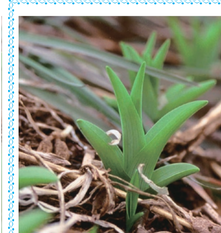
〈ヤブカンゾウの芽生〉

■キッズコミュニケーションセンター (東大和南公園サービスタワー) / 小学生以下 (小学生未満は保護者同伴) / 6457へ