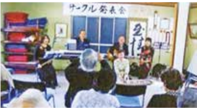
▲サークル発表会の様子

現在、男性21人、女性42人で活動しています。主に、太極拳や気功、朗読などの生きがいづくりに力を入れて取り組んでいます。年に一度開催される発表会で、日頃の活動の成果を会員の方々の前で披露しています。また、社会奉仕活動の一環として、パトロール活動に取り組んでいます。他にも新春を祝う会、夕涼み会、秋を愛でる会など季節のイベントを開催し、会員同士の交流も深めています。