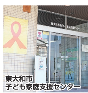
東大和市 子ども家庭支援センター

▽問合せ 子ども家庭支援センター ☎042-565-365 1まで。 ● 乳幼児を家に置いたまま保護者が外出している。 ● 子どものけがについて保護者が不自然な説明をする。 ▽連絡先 ● 子ども家庭支援センター ☎042-565-365 1 ● 児童相談所全国共通ダイヤル「189」(189(いちひやくはやく))は24時間最寄りの児童相談所につながります。 ▽問合せ 子ども家庭支援センター ☎042-565-365 1まで。