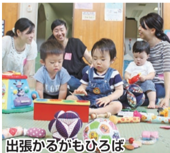
出張かるがもひろば

「赤ちゃん・ふらっと」の設置・登録を希望する事業者等の方は、設置基準等についてご案内します。赤ちゃん・ふらっとが設置されています。 「赤ちゃん・ふらっと」の設置・登録を希望する事業者等の方は、設置基準等についてご案内します。赤ちゃん・ふらっとが設置されています。