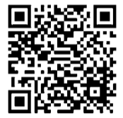
市のホームページ「保育園のおしごと」説明・相談会はこちらから

0-19) 参加費 無料 持ち物 履歴書、職務経歴書、資格証(写し)、ハローワークの紹介状(お持ちの方のみ) 主催 東大和市・東大和市私立保育園園長会 共催 ハローワーク立川 問合せ 保育課・内線1756まで。