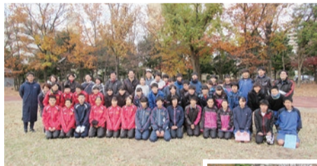
▲「東京駅伝」大会に出場する選手の皆さん

2月3日(日)に開催される第10回中学生「東京駅伝」大会に向けて、昨年12月8日に都立東大和南公園で結団式が行われました。この大会は、市内の中学2年生の中から選抜された選手で構成される男女別の駅伝チームが、区市町村対抗でレースを行う競技大会です。男子は42.195kmを17人で、女子は30kmを16人で、味の素スタジアム周辺の特設コースを走り抜けます。各中学校から選抜された選手たちは、結団式で大会での上位入賞を誓い、早速合同練習を開始しました。選手たちへ熱い声援をお願いします。