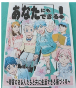
▶冊子見本。民間事業者にもしてもらいたい「配慮」に関する、障害のある人の「生の声」が詰まっています。

●自動車ガソリン費助成対象者証(うぐいす色) ●申請期間は受付できませんので、ご注意ください。 ●※振込口座等に変更があったときは、窓口でお申し出ください。 ▽問合せ 障害福祉課・内線1123まで。