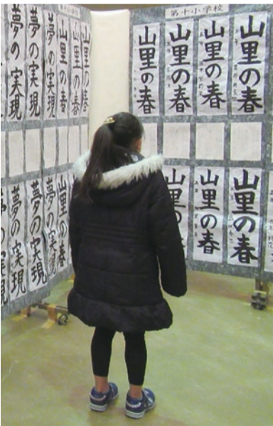
▲昨年の様子。今年も1,200点以上の子供生徒の作品が展示されます。

市内の小・中学生、高校生及び友好都市である喜多方市の小・中学生の硬筆・毛筆作品、約一、二〇〇点を展示します。