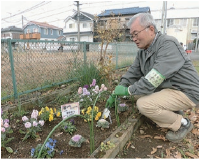
東大和市高齢者福祉計画・第6期介護保険事業計画実施状況の公表について

特色ある公園整備基本方針の中に示されている補助的な公園のテーマの一つ「花づくりを楽しむための公園」を実現するため、公園などで花づくりを楽しめる方を募集しています。興味のある方は気軽にお問い合わせください/環境課・内線1271まで。