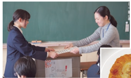
▲イラストを描いた生徒へ賞状が贈られました

学校給食を活用した食育推進事業の一環として、市内の小・中学校の給食に「イラストコロッケ」が提供されました。これは、児童・生徒が描いたイラスト(各校1作品)をコロッケに印刷し学校給食として提供することで、給食をより身近なものに感じてもらうとともに、創作意欲をかきたてるために実施されたものです。生徒たちは絵の描かれたコロッケに「すごい」と感心していました。描いたイラストが選ばれ賞状が贈られた生徒は「また次回もあったら応募したい」と語ってくれました。