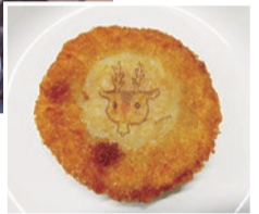
▲イラストコロッケ