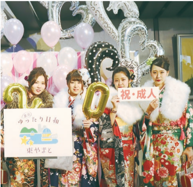
▲昨年の様子。新成人の皆さん、お誘いあわせの上、ご出席ください。

市では、新成人の門出を祝うため、「成人式」を開催します。また、式典後に成人式実行委員会による催し物も実施されます。ご家族や友人、懐かしい仲間とご出席ください。