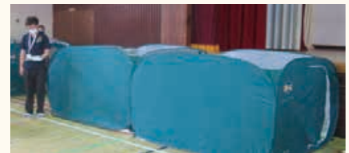
▲市では、感染症対策のため、避難所にパーティションを用意しています