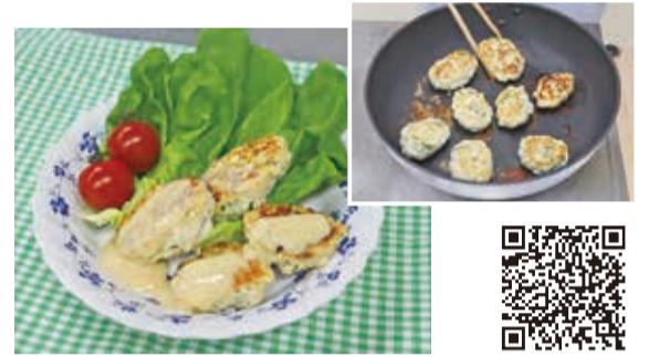
▲たんぱく質たっぷり!豆腐つくねのヨーグルトソース添え

新しい生活様式を実践する中で、自宅で調理し食事する機会が増えた方も多いのではないのでしょうか。市の公式動画チャンネルでは、簡単に作れて食べやすく、フレイル(身体的機能低下)の予防に効果のあるレシピ動画を公開しています。豆腐を使ったメニューで、動画を見ながら簡単に調理できます。たんぱく質を豊富に含み、免疫力の向上が期待でき、食べやすい一品です。この機会に、新たなメニューに挑戦してみてください。