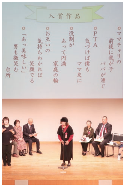
▲前回の表彰式の様子

市では、学校、家庭や職場等で感じたこと、家事・育児や家族とのエピソード等をテーマにした川柳の募集を行っています。 ▽応募資格 市内在住・在勤・在学の方 ▽募集作品 男女共同参画社会を推進し、その実現への理解と認識を深めるための川柳(五・七・五) ①作品(漢字にはふりがながない) ②住所 ③氏名(ふりがな) ④年齢 ⑤性別