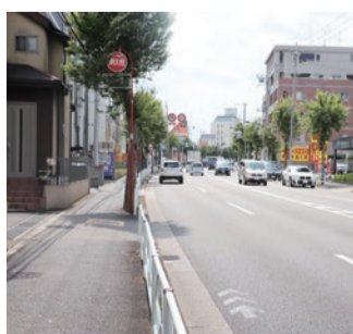
▲左上の写真と同じ場所の現在の様子

な道路になったのは、昭和44年頃。それ以前は砂利敷きの農道でしたが、車社会の発展とともに、都心と青梅を結ぶ交通動脈として整備が進められました。