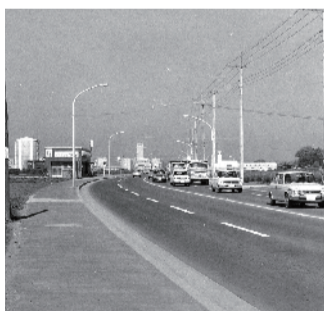
▲いちょう通りと新青梅街道の交差点から西側を撮影(昭和45年5月)