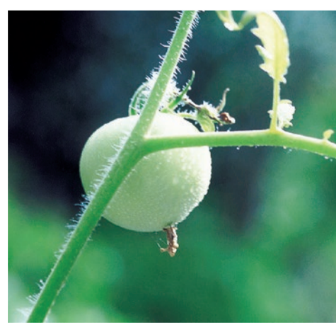
〈この時期見られる未熟なトマト〉 問合せ 郷土博物館 ☎042-567-4800