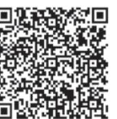
▲マイイロはこちらから

道路集水ますに汚濁水を流さないでください 雨水集水ますに油類、ペロキ、コンクリート等を流すと道路排水管を通して空堀川、奈良橋川、前川等の河川に流れ込みます。川が汚れ、魚やザリガニ等の生き物が死んでしまう原因となりますので、汚濁水は決して流さないでください。◎宅地内から道路上に枝葉を出さないようご協力を。宅地内等から道路にはみ出している樹木の枝葉は、車両や歩行者の通行の妨げとなり、接触事故等の危険があります。土地を管理している方は、枝葉を道路に出さないよう、せん定等をお願いいたします。