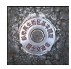
節点(赤文字のもの) 街区点補助点(白文字のもの)

おり、今後土地の分筆等の登記をするための測量に必要となります。 また、道路の掘削工事等で市の承認なく測量標の撤去や移転等はできません。測量基準点を使用する場合は測量標が支障となる掘削工事等を行う場合は、必ず事前にお問い合わせください。