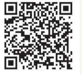
▲動画はこちらでもご覧になれます。

ご自宅で過ごす時間が長くなった方も多いと思います。東大和元気ゆうゆう体操を取り入れて、介護予防！リフレッシュ！しませんか。東大和元気ゆうゆう体操から2つの体操をご紹介します。