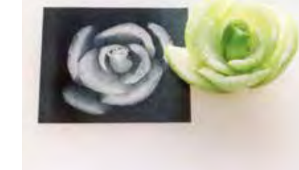
〈チンゲンサイの輪切りとコピー〉

料理しながら、植物観察。チンゲンサイの株の下の方をカットします。その断面をコピーにとってみると、バラの花にみえませんか? 葉は太陽の光を効率よく受けるため、お互い重ならないように茎に対してらせん状に付いています。そうすると、バラの花みたいになるのです。 チンゲンサイだけでなく、コマツナ、ハクサイ、キャベツ、セロリ、ホウレンソウ…。ほかの野菜ではどうでしょうか? 台所で、植物観察をお楽しみください。 でも、野菜を切ったら、なるべく早く食べないと傷んでしまいます。一度にたくさん切りすぎないように注意ください。