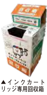
▲インクカートリッジ専用回収箱

回収したインクカートリッジはリサイクルされます。 ▽回収対象 プラザー、キヤノン、エプソン、日本HPの純正インクカートリッジ(インクタンク、インクパックは対象外) ※家庭で使用したものに限りです。 ※袋や箱に入れたまま出さないでください。