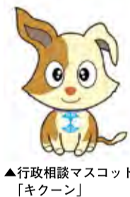
▲行政相談マスコット「キクーン」

総務大臣から委嘱された行政相談委員が、国などの仕事に関する要望等をお聞きします。相談内容の秘密は厳守します。 ◎市の行政苦情相談 ▽日時 毎月第4木曜日午前9時30分～正午(予約制) ▽場所 秘書広報課(市役所4階) ▽問合せ 秘書広報課 ☎03-3363-1111