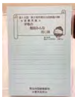
▶男女共同参画メモ帳(見本)

ぜひ、ご利用ください。 ▽配布場所 地域振興課(市役所3階)、市民センター1、公民館、図書館 ※男女共同参画のイベント等でも配布します。