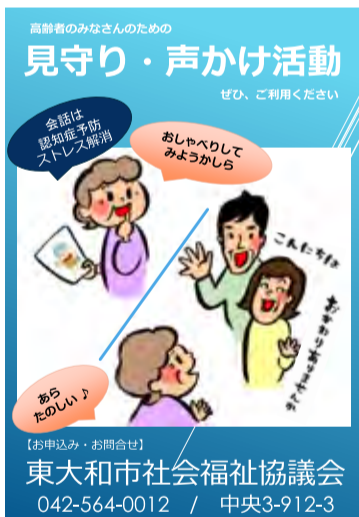
▲「見守り・声かけ活動」の新しいポスター・チラシ

った結果、新しいデザインが決定しました。ポスターとチラシは市内に掲示及び配布する予定です。 ご利用を希望される方、協力員になっていただける