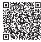
市の公式動画チャンネルはコチラ

ます。2月8日(月)までの消印があるものに限り、必要書類等の詳細は入園案内をご覧ください。 ▽入園案内の配布場所 保育課(市役所1階)、子ども家庭支援センター、市立保健センター、清原市民センター、児童館、市内保育施設 ※市のホームページからもダウンロードできます。 ▽問合せ 保育課・内線1752まで。