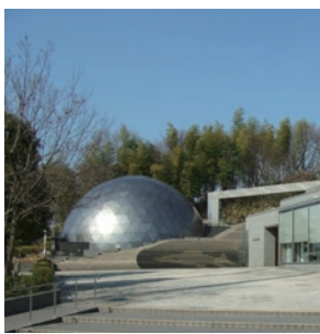
▲郷土博物館プラネタリウム

自然・歴史・民俗の面から郷土を紹介する施設として、平成6年4月に開館した市立郷土博物館。今号では、その中の設備「プラネタリウム」を紹介いたします。プラネタリウムは映像学習設備として設置され、現在では、一般観覧者が学ばず、生徒たちの校外授業の場としても活用されています。開館当時の投影機は、ドームにスライド画像を投影する方式であったため、投影できる情報に限りがありました。その後、デジタル投影機を導入したことで、星空解説を職員が行うことにより、多摩湖の星空など、地域に根差した番組を制作することができるようになりました。また、動