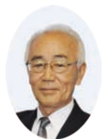
東大和市長 尾崎保夫