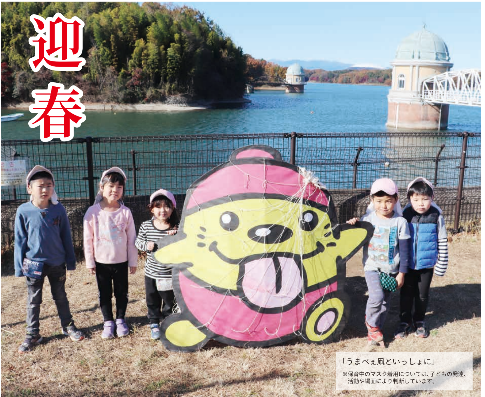
「うまべえ凧といっしょに」