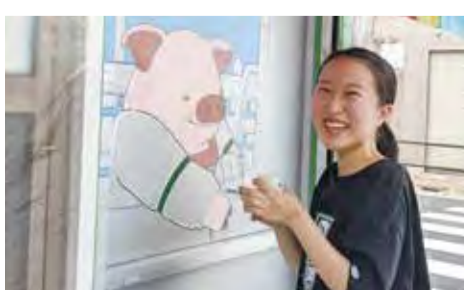
▲学生がウォールアートに取り組む様子

くじの社会貢献広報事業として、宝くじの受託事業収入を財源としたコミュニケーション助成事業であり、宝くじの助成金で実施する事業になります/産業振興課・内線1076まで。