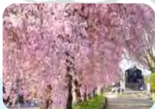
行ってみたい桜名所 全国1位になることも

「花でもてなす喜多方」というまちづくりを行っており、春は福寿草や日中線の廃線跡に全長3km続く桜並木の遊歩道、夏は三ノ倉高原の山を覆いつくす、ひまわり花、秋は大峠の紅葉、長床の黄金色に輝く大銀杏、冬は真っ白な銀世界と、四季折々の彩りが楽しめます。そのほかにも、5月の花しょうぶ、6月のヒメサユリ、7月に咲く雄国沼のニッコウキスゲの群落など、季節の「花」たちが迎えてくれます。