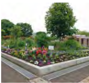
▲向原中央公園の花壇

ボランティアの協力のもと、市内約20か所の公園・駅前広場等の花壇の花の植替えを実施しました。夏に向けてきれいな花の成長を楽しみにお待ちください。また、花壇の花植え・管理等は、ボランティアによって行っています。興味のある方は、ぜひ、ご連絡ください / 土木公園課・内線1218まで。