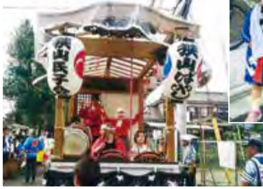
▲狭山神社の大祭でお囃子を披露した時の様子