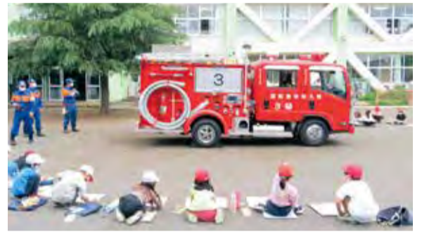
▲消防車を描く児童たち(第五小学校)

4月12日～5月11日に市内全ての小学校において、今年度で71回目となる「はたらく消防の写生会」が行われました。北多摩西部消防署や消防団から来たポンプ車や大きなはしご車、消防隊員をクレヨンや絵の具で思い思いに描く児童たち。「なんで消防車は赤いの?」「火事の時にどうやって火を消すの?」「火事の時に質問したり、消防車の装備について説明してもらったりして、児童たちは、防火・防災への理解をより深めることができました。