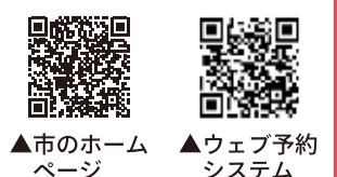
▲市のホームページ ▲ウェブ予約システム