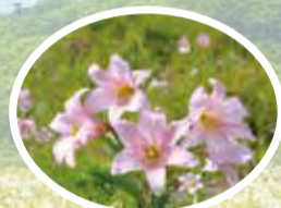
喜多方市の「花」 ひめさゆり