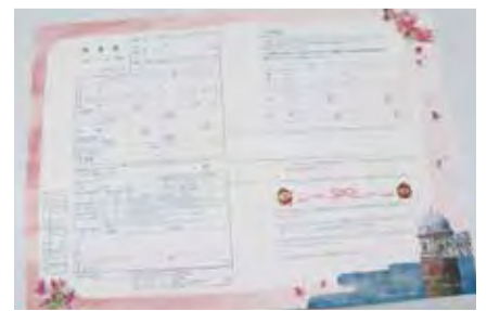
▲オリジナル婚姻届

▽配布場所 市民課(市役所1階) ◎記念撮影のコーナーを設置しています 市では、婚姻届等を提出した記念に、写真撮影ができるコーナーを設置しています。 記念日の大切な思い出として残していただくために、ぜひ、ご利用ください。 ※カメラ等の撮影機器は、ご自身で用意してください。 ▽設置場所 市役所1階市民ロビー