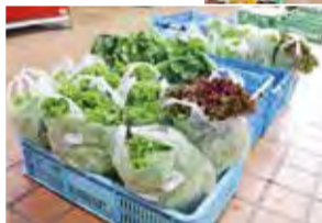
▲農産物アンテナショップの様子