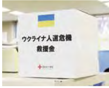
▲福祉推進課に設置している募金箱

集していますので、ご協力をお願いいたします。なお、同救援金は、三井住友銀行ずらん支店、三菱UFJ銀行やまびこ支店、みずほ銀行クスギ支店、ゆうちょ銀行、郵便局への振込みによる方法でも可能です。福祉推進課・内線1134まで。