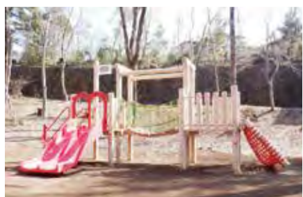
▲狭山緑地に新設された遊具