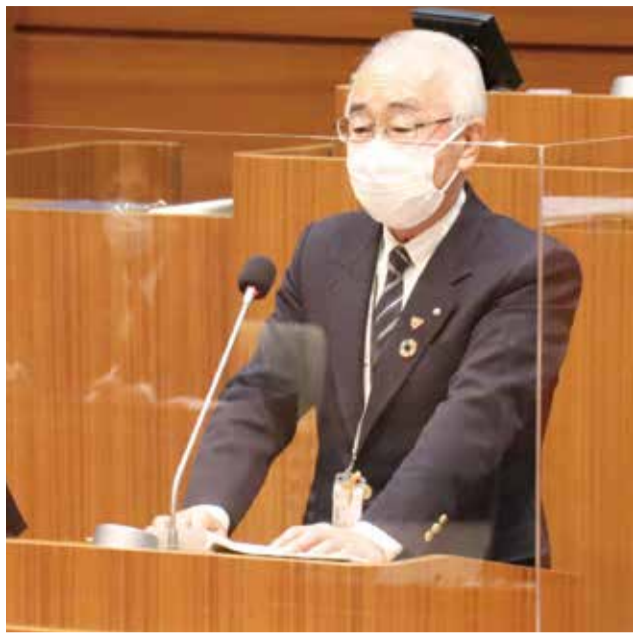
▲施政方針を表明する尾崎市長

1面の続き それでは、これより、私が考えております、令和4年度における重要施策につきまして、5点申し上げます。