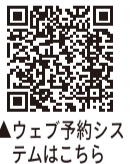
▲ウェブ予約システムはこちら

医療機関ごとの接種実施状況は市のホームページ（右の二次元コードからアクセス可）をご覧ください。