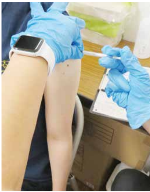
▲ワクチン接種の様子

感染症から市民の皆様の生命と健康を守るために、3回目となるワクチンの追加接種を東大和市医師会など関係機関と連携・協力し、安全かつ着実に実施してまいります。 また、国の交付金等を最大限に活用しながら、感染拡大の防止対策や感染症の影響を受ける市民の皆様への支援を引き続き実施してまいります。