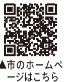
▲市のホームページはこちら

新型コロナウイルスワクチンについて、接種による効果や副反応を考慮し、接種を行うか否かをご検討ください。なお、この記事は、3月22日現在の情報に基づき作成しています。最新情報は、市のホームページ（右の二次元コードからアクセス可）をご覧ください。▶問合せ 東大和市コールセンター ☎042-563-8551まで。