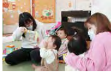
▲子ども家庭支援センターでの活動の様子

子育て支援につきましては、子ども家庭支援センターにひとり親家庭及び女性相談の機能を集約し、課として位置づけることで、子どもと家庭に関する総合相談及び支援の充実に取り組んでまいります。