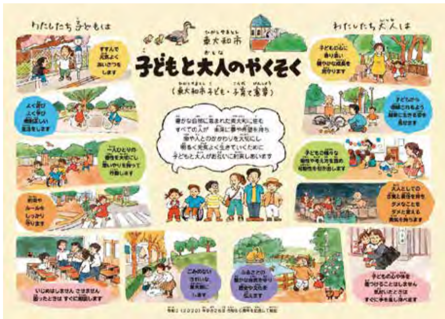
▲「子ども・子育て憲章」の普及・啓発イラスト

また、施設整備としまして、第七小学校及び第九小学校の統合に向けて、地域と共にある学校を目指し、具体的な内容を決定してまいります。