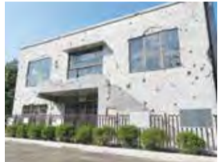
▲旧日立航空機(株)変電所

平和、歴史文化につきましては、旧日立航空機株式会社変電所の週2回の一般公開を継続するほか、「平和市民のつどい」の実施などを通じて、戦争の悲惨