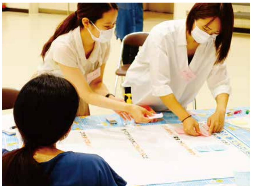
▲「快腸プロジェクト」のグループワークの様子