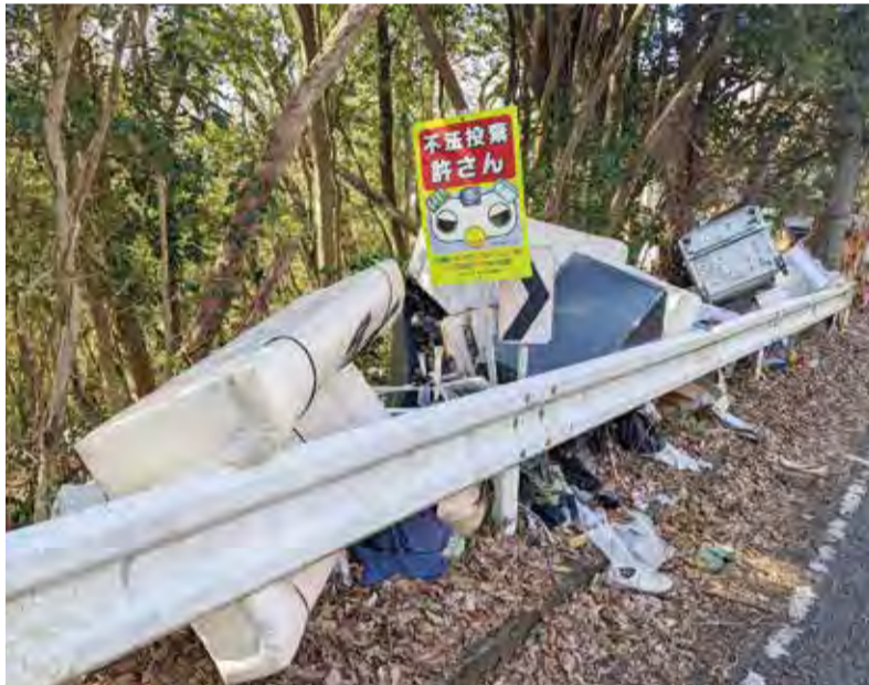
▲不法投棄された廃棄物

●廃棄物の不法投棄は、5年以下の懲役または1千万円以下の罰金に処せられる犯罪です。