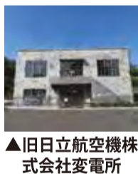
▲旧日立航空機株式会社変電所