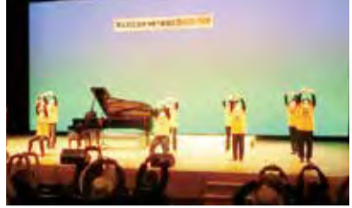
▲フレイル対策として、市が推進している元気ゆうゆう体操のイベントの様子

後期高齢者医療制度は、令和4年度に、保険料の軽減措置等を講じたうえで、保険料率の改定が行われますが、東京都後期高齢者医療広域連合等と連携を図り、制度に係る国の動向を注視してまいります。