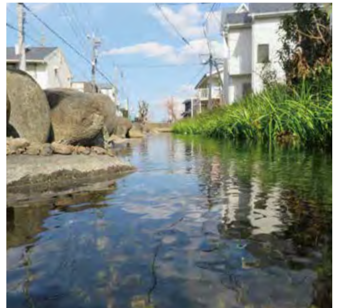
▲野火止緑地内を流れる野火止用水

くの人に住みたい、住み続けたいと思ってい ただけよう、賑わいのある魅力的な拠点形成や 拠点の後背地である住宅市街地の魅力向上など、 都市の価値を高めるまちづくりを目指した取組 を進めてまいります。 緑と水辺環境の保全を図るため、狭山緑地や 野火止緑地等の適切な維持管理に努めてまい ります。 商工業、勤労者支援につきましては、新たな 総合計画の策定を踏まえ、「産業振興基本計画」 の計画期間を令和5年度まで2年延伸し、次期 計画の策定に取り組んでまいります。 観光、ブランド・プロモーションにつつまし ては、感染症対策を講じた観光事業を推進する とともに、市の魅力や特長について、インタ ネットの検索サイトを活用するなど、効果的・ 効率的な情報発信を行ってまいります。