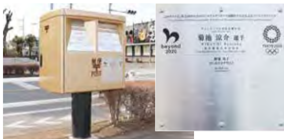
▲設置されたゴールドポスト