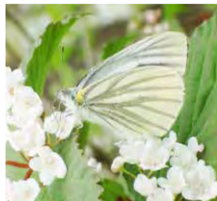
〈スジグロシロチョウ〉

ちようちよ ちようちよ 葉にとまれ 白いチョウを見ると、モンシロチョウかと思いきみがち。でも、白いチョウにもいろいろ種類があります。例えば、白いはねに黒い筋のあるスジグロシロチョウ。 もしスジグロシロチョウを捕まえたなら、はねの匂いをかいてみてください。オスですが、レモンに似た香りがします。レモンバームやレモングラスを想い浮かべる人もいるかもしれません。 観察会で、このチョウの匂いをかいた男の子が一言、「このチョウはレモンシロチョウだ!」なるほど、特徴をとらえたい名前です。