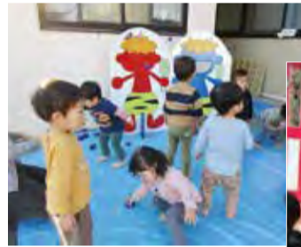
▲豆まきを楽しむ子どもたち

子ども家庭支援センター「かるがも」において、節分の豆まきを行いました。朝から、紙芝居を読んでもらったり、鬼の歌を歌ったりして、豆まきを楽しみにしていた子どもたちですが、いざ鬼がやってくると怖くて泣いてしまう子も。それでも、紙で作った豆を鬼にめがけて投げることができました。子どもたちは、「楽しかった」「もっと投げたかった」と笑顔で終えた豆まきでした。