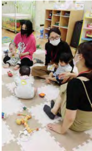
▲「0歳児親子集まれ!」の様子