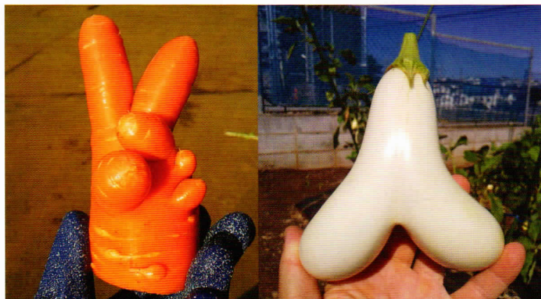
▲二股の白ナスとピースサインの人参（にんじん）

農業の大変な部分だけではなく、農業の魅力が伝わってくるお話を聞かせていただけました。お忙しい中、ありがとうございました。2021年9月 眞野さんの圃場にて