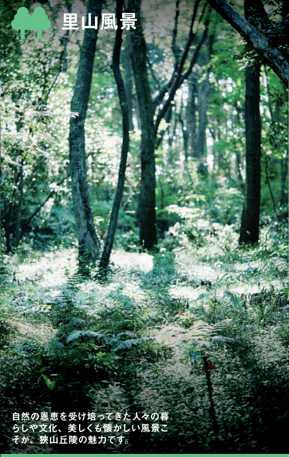
自然の息を受け培ってきた人々の暮らしや文化、美しくも懐かしい風景こそが、狭山丘陵の魅力です。