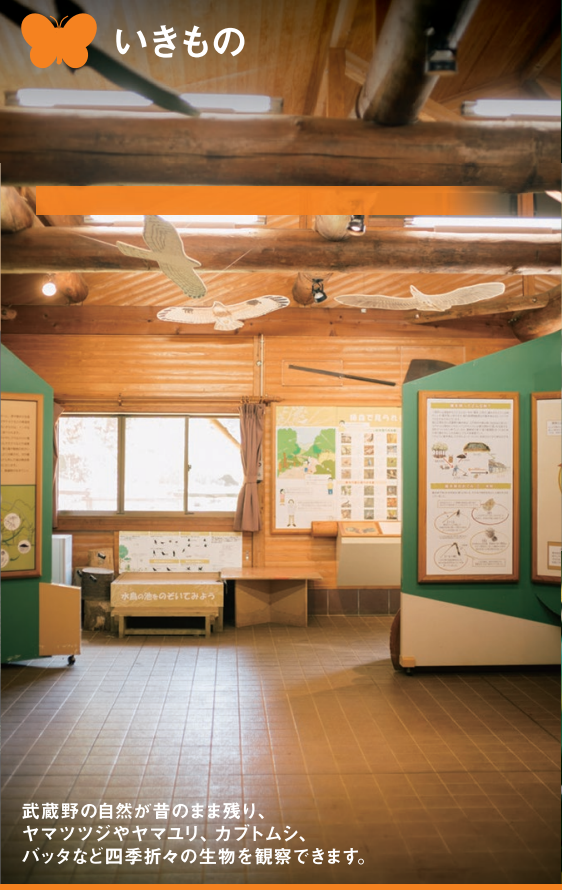
武蔵野の自然がそのまま残り、ヤマツツジやヤマユリ、カブトムシ、バッタなど四季折々の生物を観察できます。