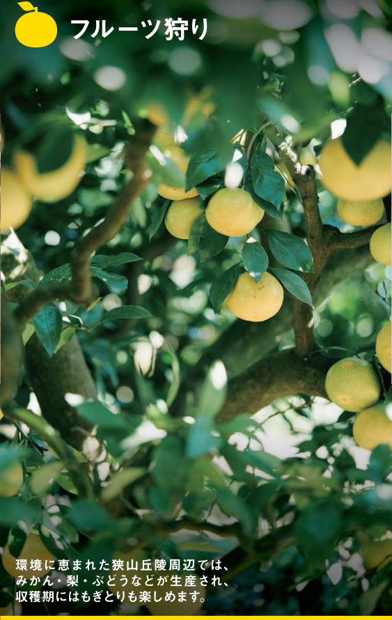
環境に恵まれた狭山丘陵周辺では、みかん・梨・ぶどうなどが生産され、収穫期にはもぎとりも楽しめます。