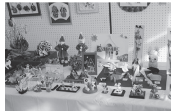
昨年のグループ展示・発表会の様子