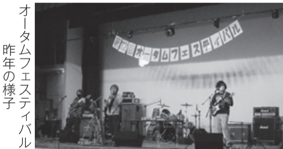
オータムフェスティバル 昨年の様子