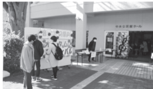
オータムフェスティバル 昨年の様子