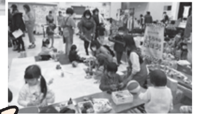
おやこふれあいフェス昨年の様子