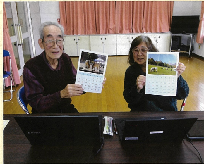
パソコンサークルのお二人 (ワードでカレンダーを作りました♪)

活動日：毎月第1木曜日 時間：13:00~16:00 場所：芝中団地管理事務所集会所（ロ号棟） 参加費：実費（印刷代等）