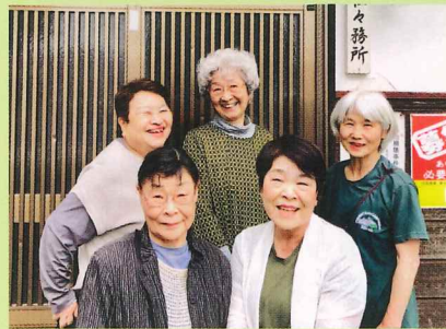
「未来は笑って隊！！高木」の皆さん

活動日：第2水曜日 時間：13:30~15:30 ※出入り自由 場所：高木神社社務所 参加費：無料 持ち物：好きなお飲み物（麦茶はあります。お菓子はありません。）