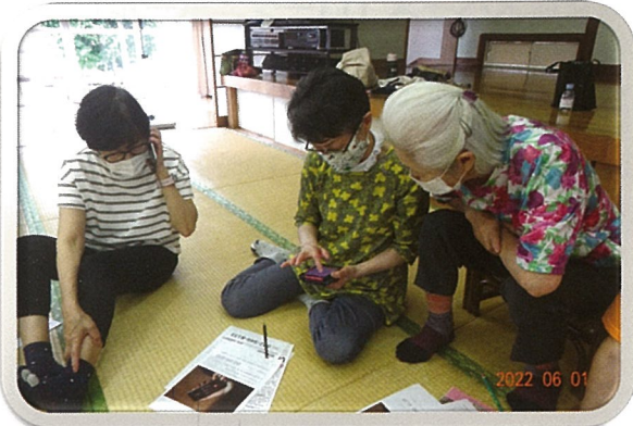
お互いに教え合いながら体験しました。

メンバーは自治会長やサロン代表者を含む市民の他、金融機関や薬局など地域に関心のある事業所の担当者など総勢10名で構成されています。生活支援コーディネーター（ほっと支援センターなんがい）が活動をサポートをしています。