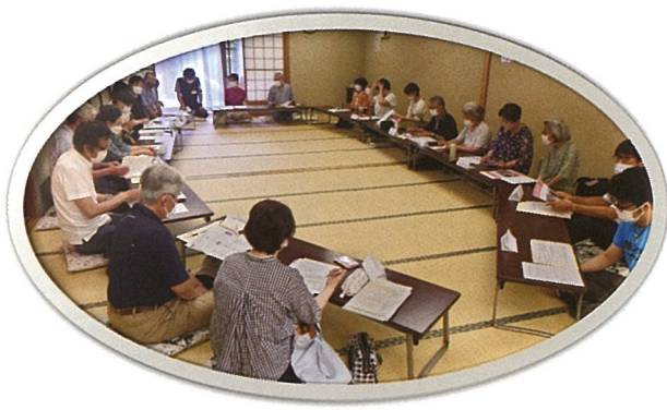
多くの方と知り会えた交流会となりました。

活動団体の横の繋がりの希薄さを地域課題と感じ、6月25日に地域で活動している団体へ声をかけ、顔合わせ・交流会を開催しました。当日は、ボランティアグループ、サロン活動、青少対、おやじの会等様々な活動団体から参加があり、活動紹介を中心にフリートークを実施しました。今後は参加団体の意見などを踏まえて今後の方向性を協議していきます。