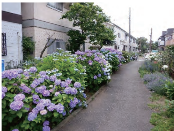
緑のボランティアの活動