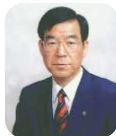
東大和市長 尾又 正則