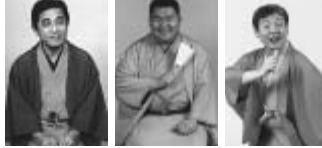
喜多八 歌武蔵 喬太郎

平成23年1月14日(金)午後7時開演 / 大ホール 全席指定 / 3,500円(友の会3,200円) 落語界の個性派3人が織り成す「落語教育委員会」。古典あり新作ありと落語の粋を詰め込んで、おまけにコントまでやってしまう、お得な企画。 フレッシュ名曲コンサート ハミング・ニューイヤー・コンサート 平成23年1月22日(土)午後2