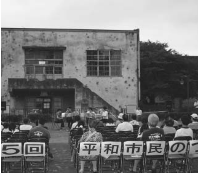
昨年の「平和市民のつどい」における平和コンサート

市では、都立東大和南公園内旧日立航空機機変電所前の平和広場にて「第6回平和市民のつどい」を開催します。この変電所は、旧日立航空機(株)立川工場で使用されていたもので、建物の壁面には戦時中、米軍の大規模な攻撃による機銃掃射や爆弾の破片によってできた無数の穴が残っています。市は、この施設を平成7年に史跡に指定し、市内に残る貴重な歴史資料として保存に努めています。「平和市民のつどい」では、この施設の存在を広く市民に知っていただくため、変電所内の見学や平和コンサートの実施、市の歴史と