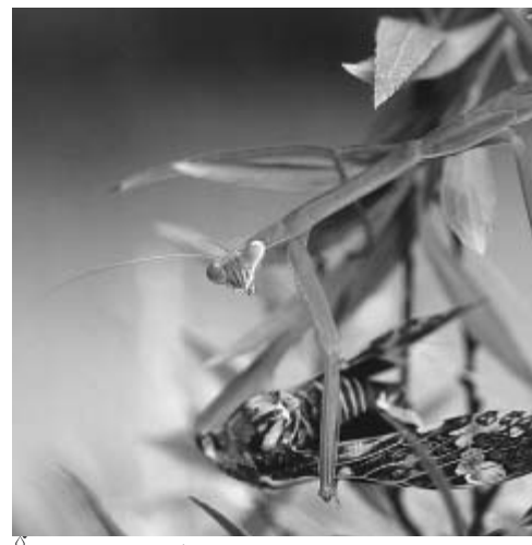
ニイニイゼミを捕まえたオオカマキリ

【郷土博物館で開催中】 プラネタリウム夏番組「さいごの恐竜ティラン」(9月5日まで) 企画展示「写真でたどる多摩の戦跡」(9月20日まで) 平和祈念・戦争資料展(17日まで、市役所1階市民ロビー) 7日 みのり納涼祭(みのり福祉園) 13日 平和市民のつどい(東大和南公園内平和広場) 31日 市・都民税、国民健康保険税、後期高齢者医療保険料、介護保険料納期限