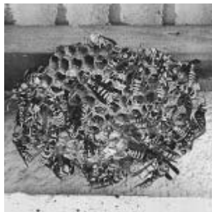
アシナガバチの巣

市では、一般住宅・民間施設にできたハチの巣の駆除は行っていません。ハチの巣ができた場合は、所有者または居住者の方ご自身において対応していただくようお願いしています。 なお、市ではハチの巣を駆除するための防護服を貸し出しています。ご希望の方は