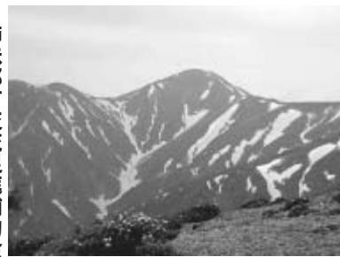
姉妹都市交流促進補助金 制度をご利用ください

定員 50人(申込順) 費用 二万二、〇〇〇円 申込み 山都町観光協会 「飯豊の集い」事務局☎02 41383830へ。