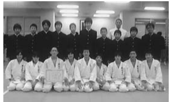
約50校が参加した東京都大会で5位入賞まで勝ち進んだ柔道部

10月30日に講道館で開催された第57回東京都中学校新人柔道大会で、第二中学校の柔道部が出場し第5位に入賞しました。この大会は、中学1・2年生で構成された5人1組の団体が対戦し、トーナメント方式で上位を目指すものです。練習を積み重ねた技術とチームワークで、素晴らしい成績を収めた皆さんのさらなる飛躍に期待しています。