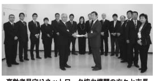
高齢者見守りネットワーク協力機関の方々と市長

金婚祝品をお贈りします 市では、市内に住所のある結婚50年目を迎えたご夫婦（昭和37年4月1日、昭和38年3月31日に婚姻届出をされたご夫婦）に祝状と祝品をお贈りしています。 申請は随時受付していますが、祝品をお贈りするのには50年目を迎えた日以降になります。