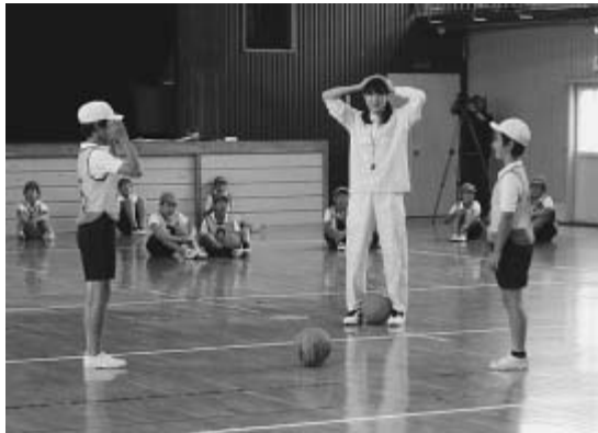
判断力を養う練習をする児童たち