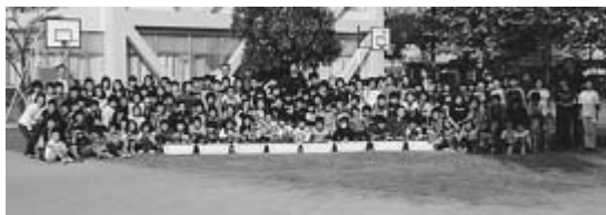
人権の花運動に参加した皆さん(上：七小、下：八小)