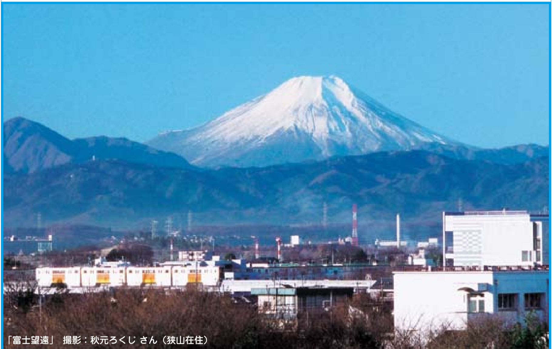
「富士望遠」

尾崎保夫 小久学 中条二美 佐間建美 尾村信夫 木崎光雄 関田正民 関田宏一 藤原洋子 西川杜成 関野庄太郎 石川洋右 粕谷庄一 中村憲二 森田由子 二宮りつ 長瀬治雄 大后久美子 粕谷 議員 (議席順) 押本治雄 副議長 松浦誠 議長