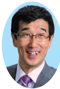
尾崎 利一 (日本共産党・現) 64歳