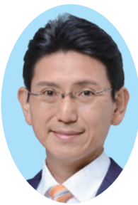
佐竹 康彦 (公明党・現) 50歳