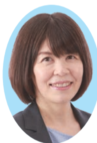
上林 真佐恵 (日本共産党・現) 50歳