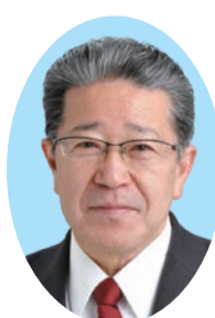
中村 庄一郎 (自由民主党新政会・現) 66歳