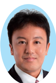
蜂須賀 千雅 (自由民主党・現) 48歳