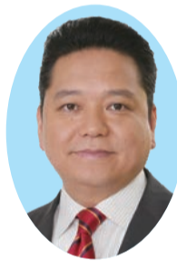
中間 建二 (公明党・現) 54歳