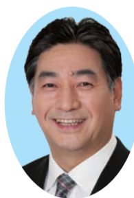
荒幡 伸一 (公明党・現) 61歳