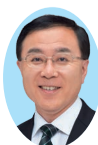
木戸岡 秀彦 (公明党・現) 65歳