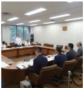
稲美町議会行政視察

令和元年7月4日に兵庫県稲美町議会無所属3名が、行政視察に当市を訪れました。視察目的は、「糖尿病重症化予防等レセプトデータを利用した保健事業」について、市民部長、保険年金課職員が当市の保健事業の実施経緯や内容等について説明しました。