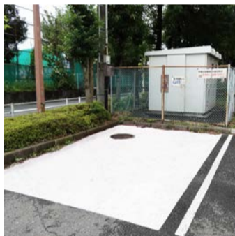
思いやり駐車ゾーン

公共施設における障害者等用駐車区画の整備状況は。狭山、蔵敷の両公民館、小学校等一部の施設で設けていない。公民館は、地域住民のための拠点施設として、中心的な役割を