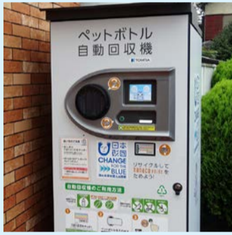
ペットボトル自動回収機

問 市道と私道が複雑に混在した中で、今後の道路整備の課題を、どのように考えているのか伺う。 答 新堀地域の私道は昭和30年代に築造された道路が多く、市に移管するには再整備が必要。また、道路として分筆する必要もある。まずは地域の方々に私道の状況を御理解いただき、住民からの相談には、丁寧に説明をしていく。