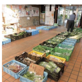
市役所口ピーアンテナショップ

要望 市長においては、特産品のトップセールスマンとして頑張っていたが、生産者の生産意欲向上等につなげていただくよう要望する。 問 昨今の社会情勢の中、防犯カメラの設置拡大が望まれているが、新設する場合の選定基準などについて伺う。 答 設置場所は、防犯の観点から各学校やPTA等、保護者の方の御意見を求め、これらを参考に、市内全体のバランスを考慮して教育委員会にて決定している。 要望 防犯カメラを設置することにより、犯罪の抑止効果が期待される。児童・生徒の安全対策推進のためにも設置拡大を要望する。