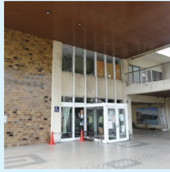
東大和市立中央公民館

問 幼児教育無償化に伴う食料費の実費徴収で、保育料が無料になっても負担がふえる方が26人という試算。差額を市が負担する等の要望をしているが、検討状況は。 答 保育料の額を超えないようにと考えている。