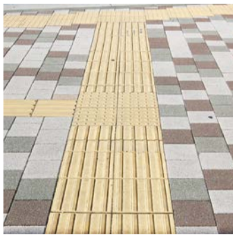
視覚障害者用点字ブロックの設置

問 幅広い世代が参加できる健康ポイント事業の展開はできないか。 答 ささまざまな手法があるため、情報収集し事情を踏まえ検討する。 問 中央公民館正面及びホール入りの点字ブロックの設置を要望しているが、進捗状況を伺う。