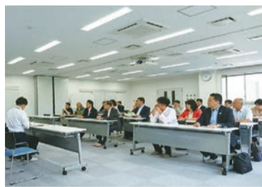
エコプラザ スリーハーモニーの研修室での施設説明

当日は、小平・村山・大和衛生組合資源物中間処理施設(愛称:エコプラザスリーハーモニー)小平市、東大和市、武蔵村山市3市の家庭などから排出される廃棄物のうち、リサイクルできるペットボトルと容器包装プラスチックの選別、圧縮、梱包及び保管を行う施設)を議員22名が見学しました。