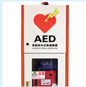
AED(自動体外式除細動器)

問 AEDの設置について伺う。 現在51の公共施設に設置、ほかに消防団のポンプ車、青色回転灯パトロールカーに搭載している。 室内にあるAEDを外に設置することで、効果的に使用できると考えるが、市の認識を伺う。