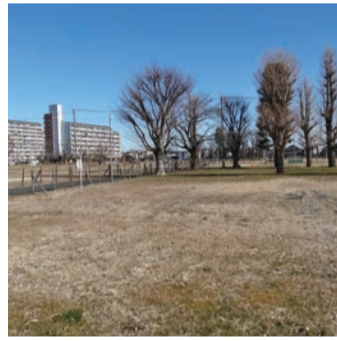
都営向原団地の創出用地

問 都営向原団地の南側創出用地に関して、私は一貫して、北側は特別支援学校、南側は住宅建設ではなく、防災に備えた原っぱにすべきと考えている。多くの皆さんから同感だ、ぜひそうしてほしいという声はいただいた。 都営住宅も高層化されたとはいえ多くの人が住んでいて、周辺も住宅が多い中、貴重な空き地が本