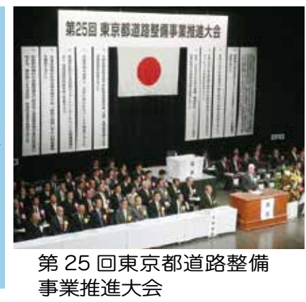
第25回東京都道路整備事業推進大会

東京都道路整備事業推進大会に出席しました 10月30日に、第25回東京都道路整備事業推進大会が日比谷公会堂で開催され、当市議会からは15名の議員が出席しました。 大会は23区、39市町村で構成され、当日は道路事業関係者が出席して、意見発表を行い、大会宣言、大会決議を採択しました。