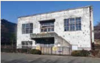
旧日立航空機株式会社変電所

要望 本管のみならず、取りつけ管についてもしっかりと維持管理がなされ、地震対策、老朽化対策が万全にとられることを期待する。