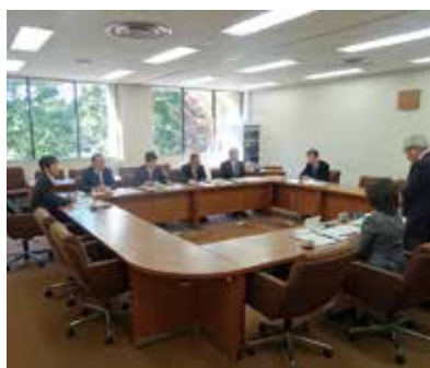
苦小牧市議会行政視察

苦小牧市議会が行政視察で来訪しました 11月13日に、北海道苦小牧市議会の会派が、「不登校対策プロジェクト」について、行政視察に当市を訪れました。当日は、学校教育部長指導主事が、事業概要について説明しました。