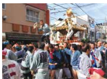
247号(11月1日発行) 「南街夏まつり」