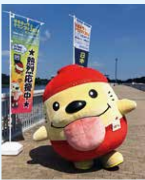
東大和市観光キャラクター「うまべえ」

ゆるキャラグランプリの投票数は、毎日の基礎票の積み重ねによって得られた結果である。基礎票数と後半に向けての伸びは。正確な数を捉えるのは難しいが、基礎票となったID数は300くらいで、約1割の伸びがあった。