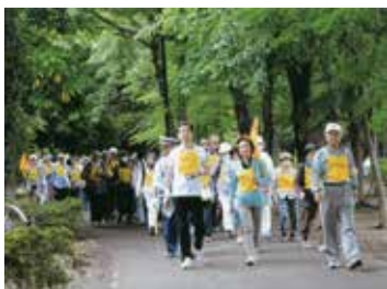
246号(8月1日発行) 「皆さんと元気にウォーク」