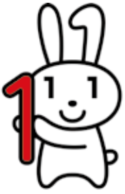
マイナンバー制度の広報用ロゴマーク「マイナちゃん」

答 平成27年10月から個人番号の付番と通知が行われ、平成28年1月から個人番号カードの交付と番号の利用が始まる。社会保障・税制度の効率性、透明性を高め、利便性の高い公平、公正な社会を実現するための制度だ。個人番号は、