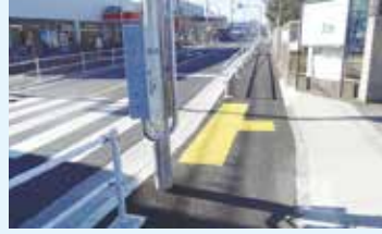
拡幅された歩道 (市道第1号線)

問 市道第1号線の改良については以前から要望があったが、平成25・26年度に行われた改良工事の内容と今後の予定について伺う。