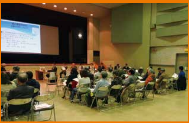
第3回議会報告会の様子

11月16日(日)午後2時から、中央公民館ホールにおいて、第3回議会報告会を開催しました。約2時間の報告会の内、前半の1時間で、9月議会における審議内容と結果を報告し、後半1時間では、参加者からの質疑やご意見をお伺いしました。参加者は27名で、1・2回目と同様に、貴重なご意見等をいただきました。