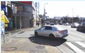
東大和市駅前信号

以前の一般質問で、東大和市駅前信号の歩車分離式への変更について要望したが、歩車分離式になっていない歩行者信号がまだある。歩行者の安全、自動車の交通渋滞解消においても必要だと思いが、どのように考えているのか。