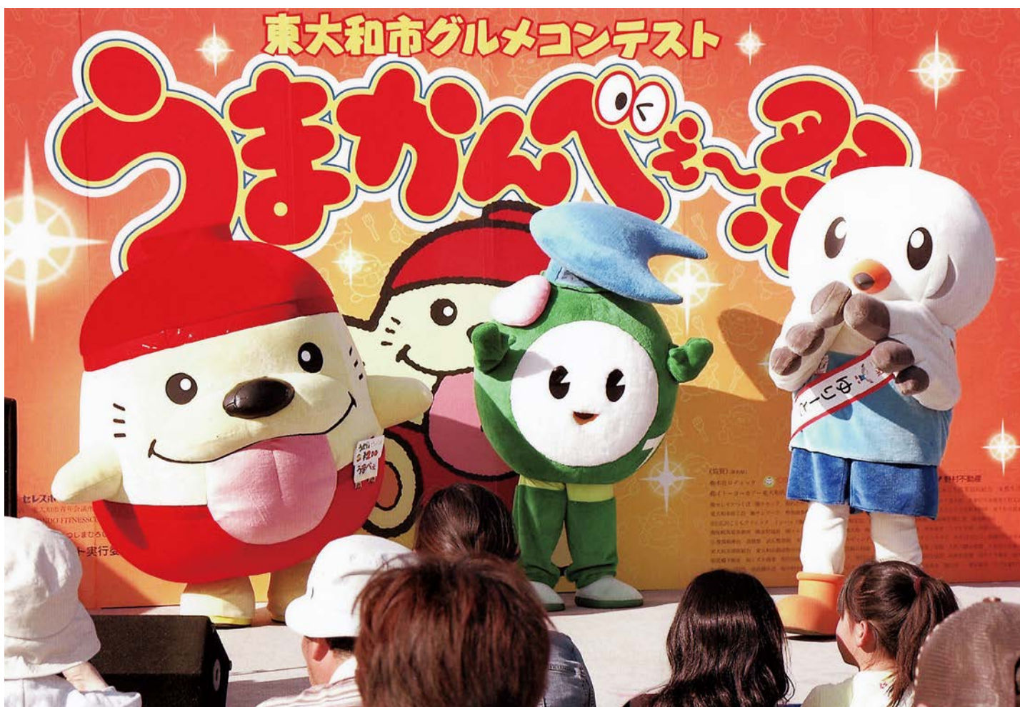
▲左から「うまべえ」、「シルバーくん」、「ゆりーと」