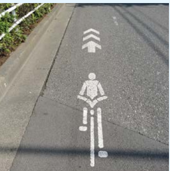
自転車ナビマーク

問 「東京都自転車利用の安全で適正な利用の促進に関する条例」の施行を踏まえた市の取り組みは。