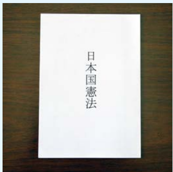
日本国憲法パンフレット

問 市では日本国憲法のパンフレットを公共施設で展示・配布しているが、実績について伺う。