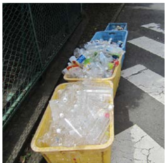
資源ステーション

問 3市廃プラ施設建設について。市民を入れた検討組織の設置、全体の事業計画から廃プラ施設建設計画を切り離すという住民の要求には道理があるのではないかと。