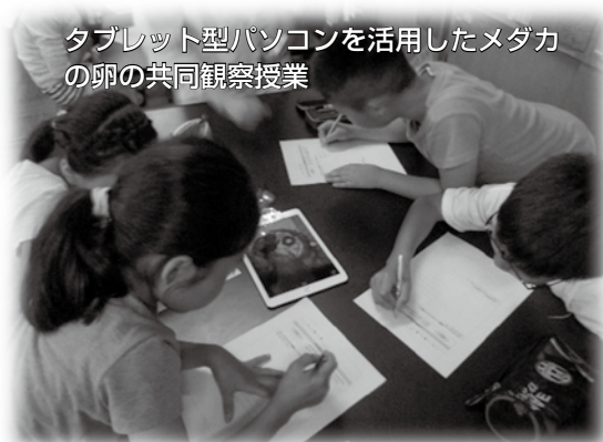
タブレット型パソコンを活用したメダカの卵の共同観察授業

東大和市では、東京都教育委員会の支援を得て、「理数授業特別プログラム」を小・中学校全校で実施します。