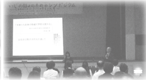
▲昨年のシンポジウムの様子