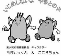
東大和市教育委員会 キャラクター やまこっくん & こころちゃん