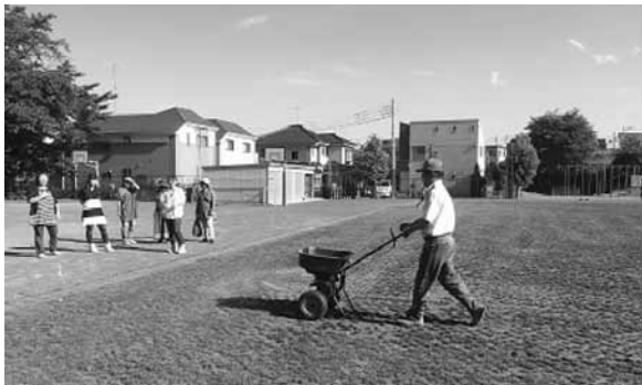
▶第四小学校の肥料播きの様子

さらに、校庭芝生化から4年が経過しました第四小学校では、ボランティアの方々にも、以前は専門業者にて行っておりました肥料播き作業についても、芝刈り作業とともに行っていただいております。 良好な芝生を維持するため、今後ともご協力ご参加をよろしくお願いたします。