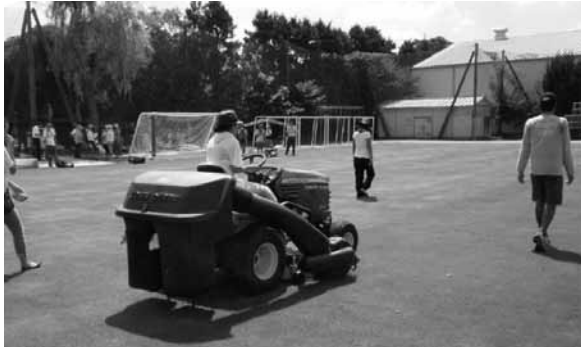
▶第八小学校の芝刈りの様子

これに伴い、排水設備やスプリンクラーの設置、校舎屋上防水工事等も補助を受けました。校庭の芝生は、専門的知識や機械が必要な作業については専門業者に委託しておりますが、芝刈り作業等の日常管理はおやじの会、PTA、校庭利用団体、地域在住の方、学校関係者等のボランティアの方々に行っています。